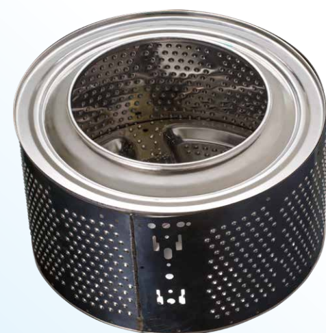
ドラム式洗濯槽 SUS430 10.4